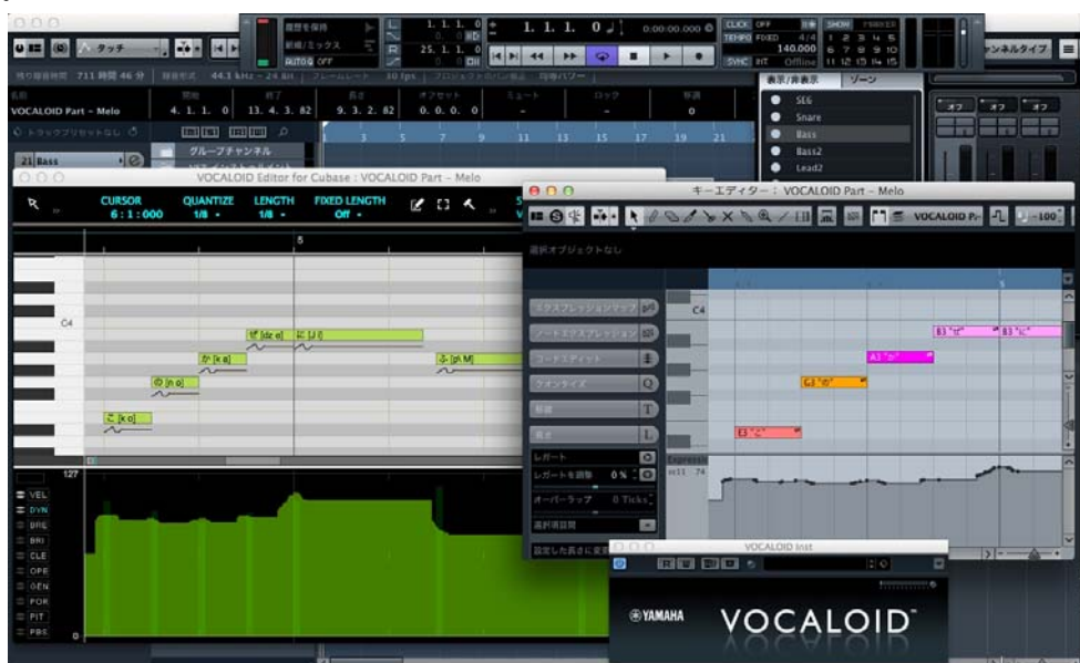
『VOCALOID™ Editor for Cubase NEO』 編集画面 (Mac での使用イメージ)

「VOCALOID™」を使った従来の制作環境ではあらかじめ伴奏を用意しておく必要がありましたが、その作業を歌声のパートを制作しながら行えるようになり、他のパートも含めた入力・録音から音質の調整などのミキシング、トラックダウンまでの楽曲制作を一貫して行うことが可能となります。