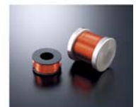
カスタムメイドの空芯コイル