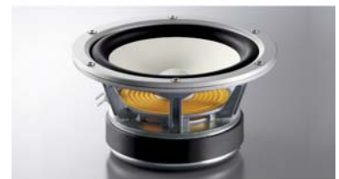
New A-PMDを採用したミッドレンジ(上)/ウーファー(下)