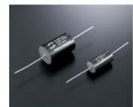
ICW社製フィルムコンデンサー

ネットワーク部には、素子同士を直接結線して伝送ロスを防ぐダイレクトコネクション方式を採用しました。ICW 社製フィルムコンデンサーやカスタムメイドの空芯コイルなど、ヒヤリングで吟味した高音質パーツのみを厳選採用するとともに、定数の再調整によって各ユニット間の自然な音のつながりを実現。スピーカーの存在を忘れて音楽そのものに入り込める、滑らかで耳当たりの良いサウンドをお楽しみいただけます。