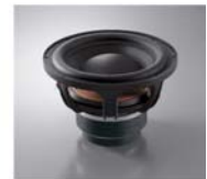
25cm口径 F.B.P.ウーファーユニット