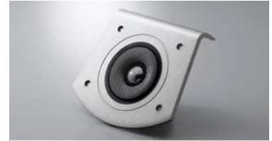
ツイーター周囲の不要共振を抑える アルミダイキャスト製大型パッフルプレート

ツイーターには、振動板とボイスコイルボbinを高度な“絞り”の技法で一体成型し、高域の情報量と解像度を飛躍的に向上させるアルミマグネシウム合金製の DC-ダイヤフラム(DC=Direct Coupled)方式ドーム振動板を採用。磁気回路はネオジウムマグネットを用いた内磁型とし、ボbinに巻かれたボイスコイルの真円度を高めた組み立て精度の向上などの改良を積み重ねることで、緻密な情報量と高域へ向けての伸びやかさを実現しました。