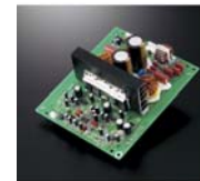
高効率デジタルアンプ