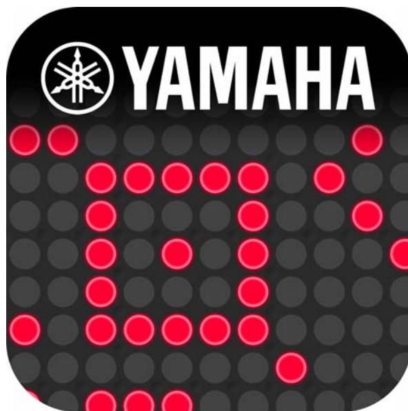
iPad/iPhone 向けアプリケーション 『TNR-e』

*Apple、iPad、iPod touch および App Store は、米国およびその他の国々で登録された Apple Inc. の商標です。