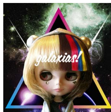
「galaxias!」の1stアルバムに登場した「galaco(ギャラ子)」

本製品は、2011年11月から2012年6月にかけて開催された「VOCALOID3 発売記念楽曲コンテスト」の特別参加賞である「VOCALOID3 Library galaco (ギャラ子)」を改良し製品化したものです。当初、「VOCALOID3 Library galaco (ギャラ子)」には製品化の予定はありませんでしたが、多数のリクエストを受けて『VOCALOID3 Library ギャラ子 NEO』として製品化するにいたりました。なお、製品名およびシンボルキャラクターに採用されている「ギャラ子」は、「柴咲コウ」、「DECO*27」、「TeddyLoid」による音楽ユニット「galaxias!」のデビューアルバムに登場した、「柴咲コウ」さん発案のキャラクター「galaco(ギャラ子)」に由来します。