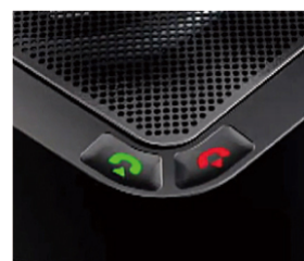
電話接続／電話切断ボタン

各種調整ボタンを搭載することで、直感的でかんたんな操作環境を実現。FLX UC 500 の「音量調整ボタン」や「電話接続／電話切断ボタン」で、Web 会議等での音量の調整や接続・切断の操作ができます。また、「ミュートボタン」を押すことで、通常の遠隔会議の会話を中断して発話者側のみの会話を可能とします。