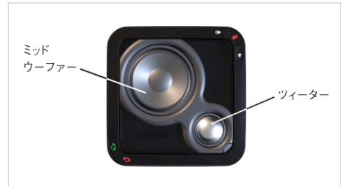
2基の内蔵スピーカーが高音質を実現

「FLX UC 500」は、ツイーターとミッドウーファーのスピーカー2基を内蔵し、ピーク音量 93dB の大音量とともに高音質な拡声環境を実現。さらに、2基の内蔵スピーカーは、一般的なマイクスピーカーよりも周波数帯域が広く、Web 会議やソフトフォン等を使用した遠隔会議、授業・セミナー等の遠隔講義の用途などで、聞き取りやすく快適なコミュニケーションを可能にします。