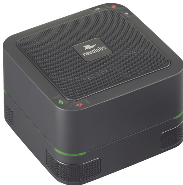
Revolabs 社 USB スピーカーフォン 『FLX UC 500』 本体価格 60,000 円(税抜)

※FLX UC 500 の画像データは下記ウェブサイトよりダウンロードできます。 http://jp.yamaha.com/news_release/