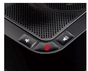
音量調整／ミュートボタン

※「電話接続／電話切断ボタン」が使える Web 会議は、今後当社ホームページにて公開予定です。