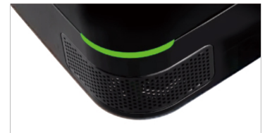
360度收音できる4基の高性能マイク

全4基の高性能マイクを本体に内蔵し、360度どこからでも收音可能な環境を実現。また、広範囲な周波数を收音できるマイク性能により会話の聞き取りを格段に向上させることで、Web 会議やソフトフォン・ボイスチャット等の利用時に、話者が本体に近づいたり声を張り上げたりする必要はありません。