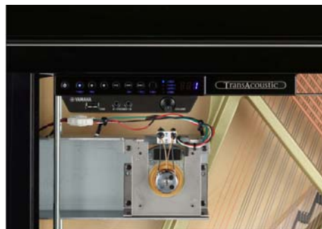
電子音の信号を振動に変えるトランスデューサー(囲み部分)