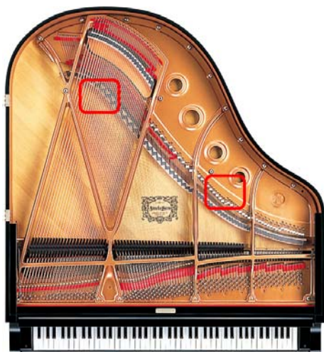
グランドピアノは響板の裏面に設置 (画像は C1X-SHTA)