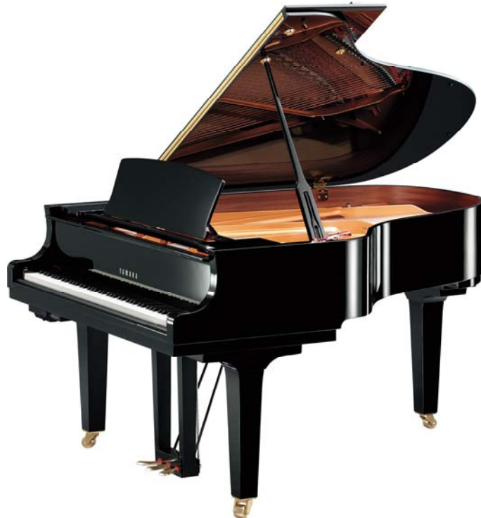
ヤマハ トランスアコースティック™ ピアノ『C3X-SHTA』