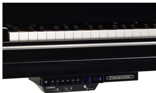
コントロールユニット(C1X-SHTA、C3X-SHTA)