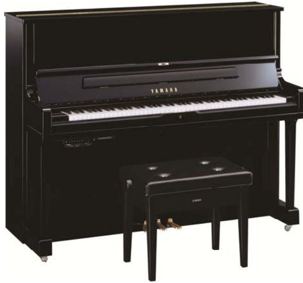
ヤマハ トランスアコースティック™ ピアノ『YUS1SHTA』