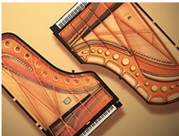
左：ヤマハ CFX 右：ベーゼンドルファー インペリアル

ヤマハグランドピアノの最高峰である「CFX」とベーゼンドルファー「インペリアル」からサンプリングした2つの音源を搭載。グランドピアノの複雑な弦共鳴音を再現する技術「バーチャル・レゾナンス・モデリング (VRM)」などにより、いっそう表情豊かな音を生み出します。また『CVP-709/705』へは木製鍵盤を搭載し、『CVP-709』には「カウンターウェイト」も採用し、タッチ感を向上させています。