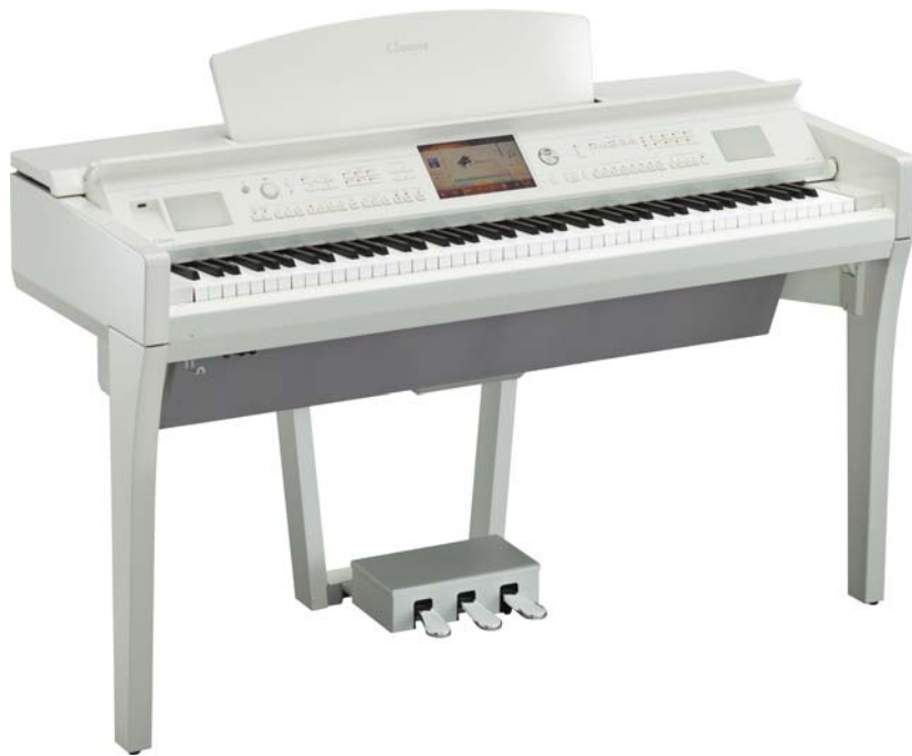
ヤマハ 電子ピアノ クラビノーバ『CVP-709PWH』