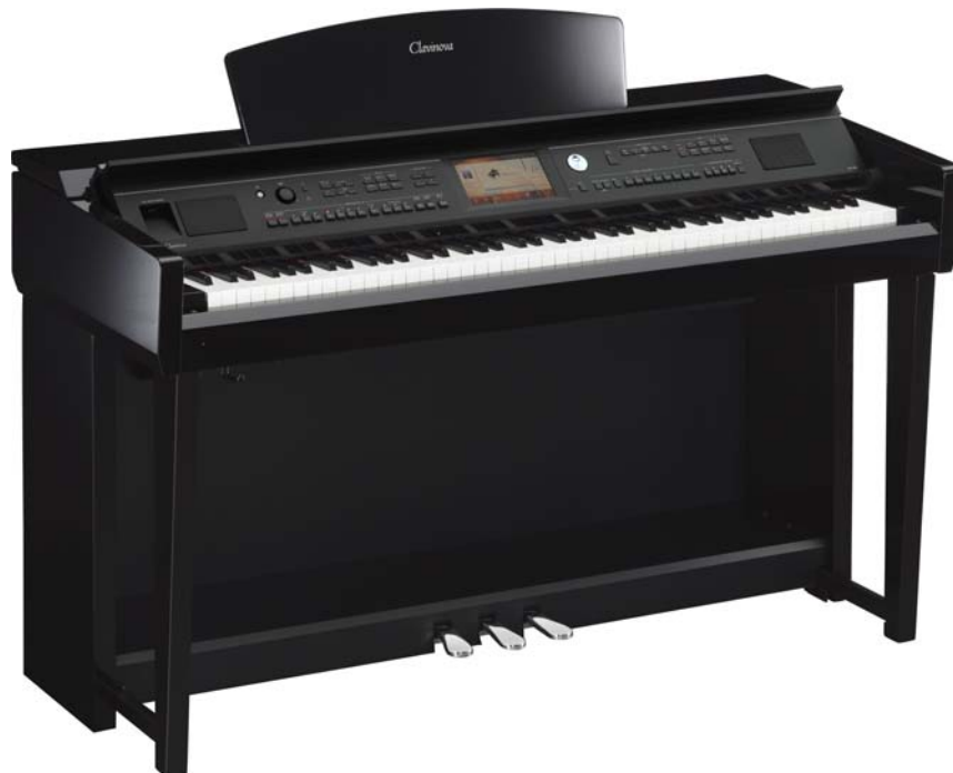
ヤマハ 電子ピアノ クラビノーバ『CVP-705PE』