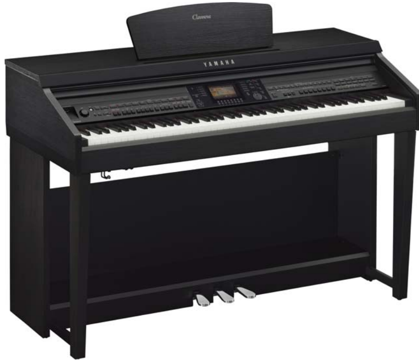
ヤマハ 電子ピアノ クラビノーバ『CVP-701B』