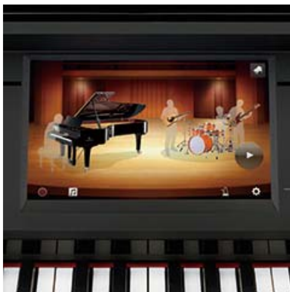
演奏のパートナーを選べる「ピアノルーム」の「セッションモード」（CVP-709 画面）

また、ピアノルームで選べるスタイルはドラムパートをオーディオ収録し、より臨場感のあるバックギングを楽しめる『オーディオスタイル』が多く採用されています。（CVP-709）