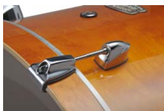
アブソルートラグ