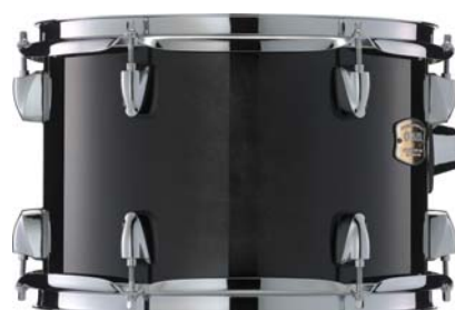
レーベンブラック (RB)