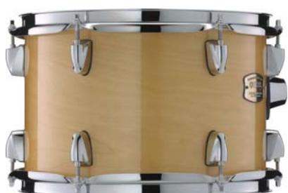
ナチュラルウッド (NW)