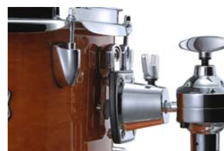
Y. E. S. S.