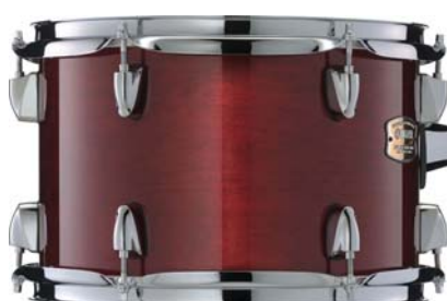
クランベリーレッド (GR)