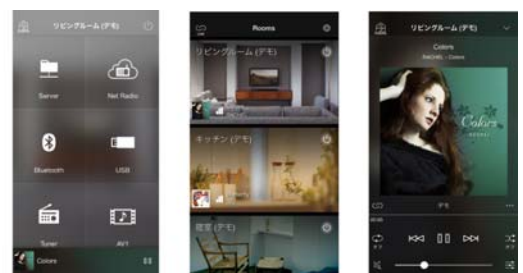
専用アプリ「MusicCast CONTROLLER」(スマートフォン版)の操作画面例