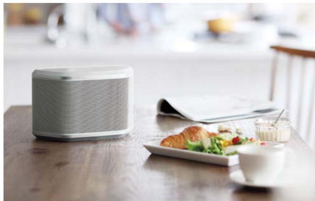
「WX-030(W)ホワイト」設置イメージ