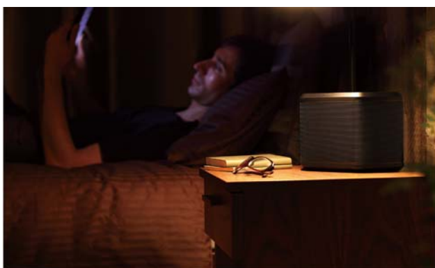
寝室のベッドサイドでの設置イメージ

自然にインテリアに溶け込む、シンプルなデザインを採用しました。コンパクトサイズで設置場所を選ばずに、ベッドサイドやキッチンなど音楽を聴きたい場所に気軽に置いて楽しめます。また、タッチセンサーの本体ボタンを装備し、簡単に電源のオン/オフ操作が可能です。さらに、壁掛けにも対応し、好みに合わせて設置スタイルを選べます。