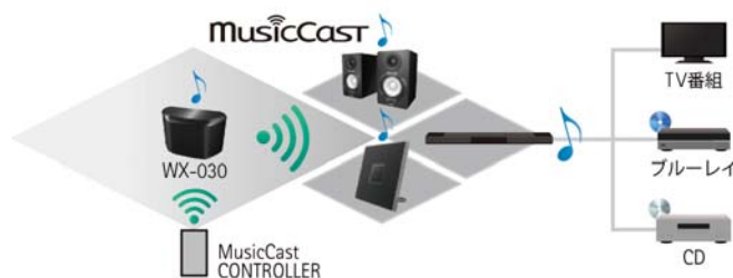
「MusicCast」ネットワーク接続イメージ図