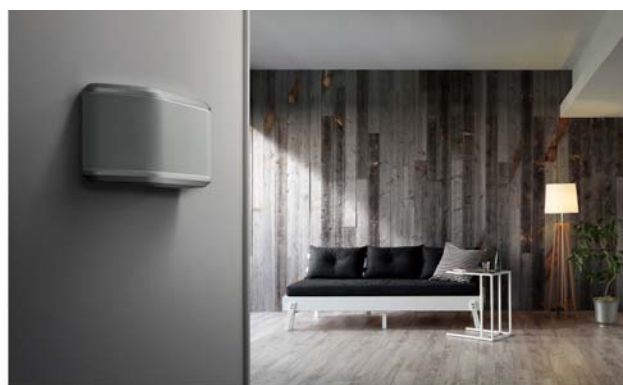
壁掛けの設置イメージ