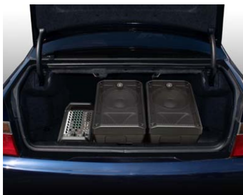
スピーカーシステム「CBR12」との積載例