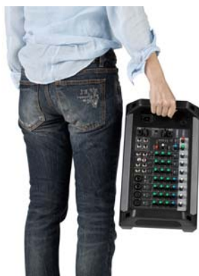
持ち運びに便利なハンドルを装備