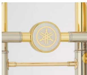
「京都オパール」を採用したバランサー

京セラが独自開発した装飾用素材である人工宝石「京都オパール」をバランサーに採用し、華やかさと高級感を表現しました。またベルに20周年記念の彫刻を施しているほか、一部に「京都オパール」を施した人工象牙のレバー指当てや特別色の石突きなど白色を基調とした装飾を加え、レギュラーモデルと異なる雰囲気を出し記念モデルにふさわしい特別感のある外観としています。