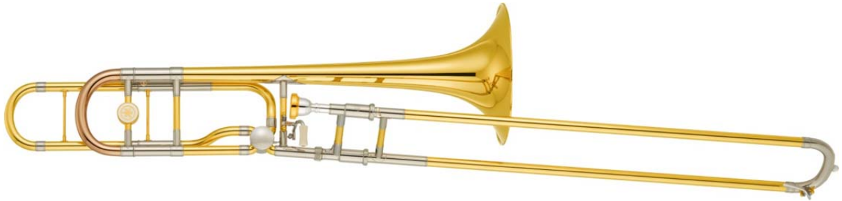
ヤマハ トロンボーン「Xeno」 『YSL-882020TH』 405,000 円（税抜）