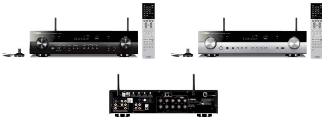
ヤマハ AV レシーバー 『RX-S602』 カラー:(B)ブラック/(H)チタン 本体価格 73,000 円(税抜)

『MusicCast BAR 400』『MusicCast SUB 100』の予約受付は2018年9月20日(木)より開始する予定です。実際の予約受付開始日につきましては、各販売店により決定されます。