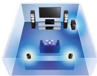
MusicCast Surround (ワイヤレスリア+ワイヤレスサブウーファー)