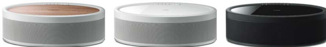
ヤマハ ワイヤレスストリーミングスピーカー 『MusicCast 50』 カラー:(MN)木目/ナチュラル/(W)ホワイト/(B)ブラック オープン価格

【製品情報】 https://jp.yamaha.com/products/audio_visual/sound_bar/musiccast_bar_400/index.html