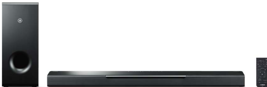
ヤマハ フロントサラウンドシステム 『MusicCast BAR 400』 オープン価格

【製品情報】 https://jp.yamaha.com/products/audio_visual/av_receivers_amps/rx-s602/index.html