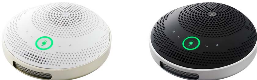
ヤマハ ユニファイドコミュニケーションスピーカーフォン 『YVC-200』