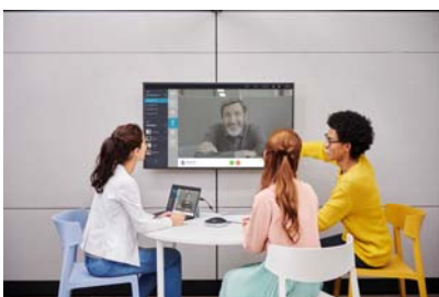
打ち合わせスペース