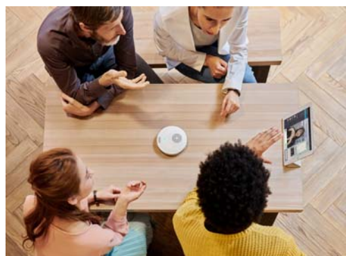
打ち合わせスペースに持ち込み即座に遠隔会議を始められるので、チームコラボレーションを活性化させます。