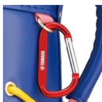
小物などを掛けられる 「大型カラビナ」