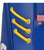
グローブ、サンバイザーや サングラスなどを掛けられる 「アクセサリロープ」