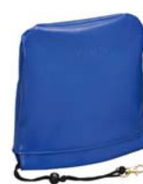
クラブを傷から守るための 「アイアンカバー」