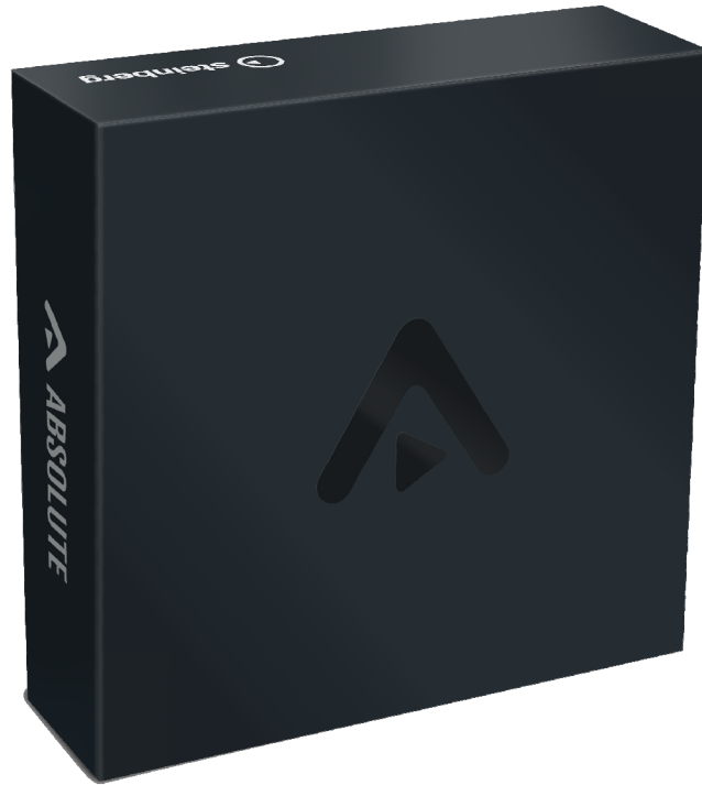
スタインバーグ ソフトウェア 『Absolute 4』 オーブンプライス