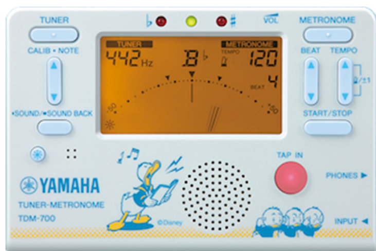
<ヤマハ チューナーメトロノーム『TDM-700DD2』ドナルドダック 価格：4,700円（税抜）>