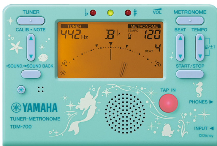
<ヤマハ チューナーメトロノーム『TDM-700DARL』アリエル 価格：4,700円（税抜）>