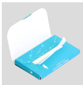
<ヤマハ クリーニングペーパー 『CP3DARL』 アリエル 価格：500 円（税抜）>