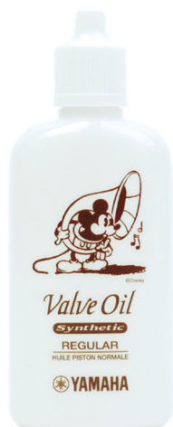
<ヤマハ バルブオイルレギュラー 『VOR2DMK』 ミッキーマウス 価格：750 円（税抜）>