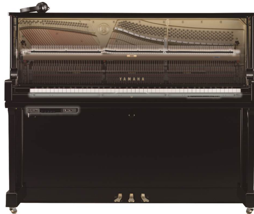
『RSC2 シリーズ』ユニット導入イメージ

ヤマハ株式会社は、当社のアップライトピアノに消音機能を追加するユニットの新製品として、ヤマハ サイレントピアノ後付けユニット『RSC2 シリーズ』を10月2日（水）から発売します。