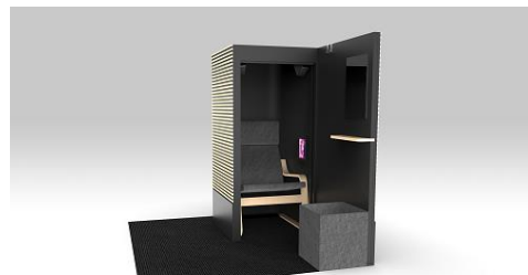
仮眠システム イメージ

ヤマハが研究を進めている生体リズムに連動した快眠音で心地よい入眠を支援する「仮眠システム」を導入することで、従来推進してきた「Power Nap」の質をさらに高めることを狙いとしています。本仮眠システムは、2019年2月より成田空港にてトライアルが実施されるなど既に効果検証が進められており、アビームコンサルティングにおいては本日より全社員を対象にトライアルを実施し、効果検証を進めます。