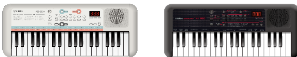
(左から) ヤマハ電子キーボード 『Remie (PSS-E30)』 『PSS-A50』

ヤマハ株式会社は、ミニ鍵盤を備えた電子キーボードの新製品として、子ども向けモデル『Remie (レミィ: PSS-E30)』と、高機能モデル『PSS-A50』を11月20日(水)に発売します。