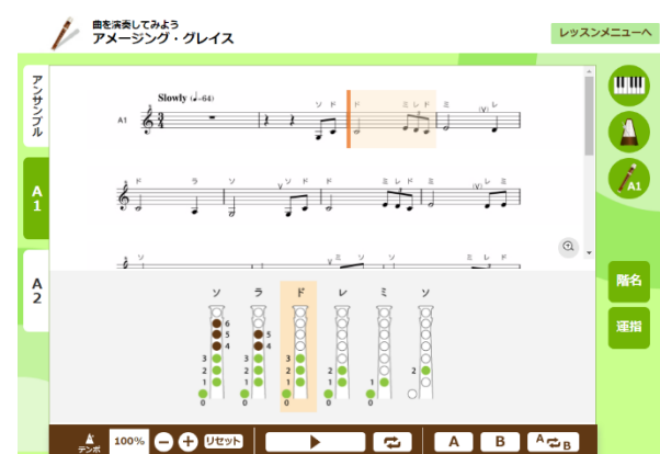
『アルトリコーダー授業』教材画面