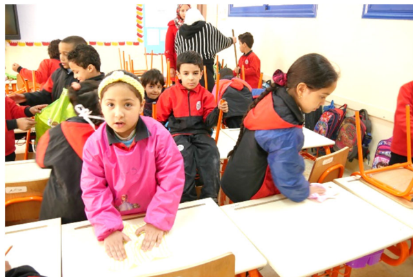
「エジプト・日本学校」 ※3 の様子