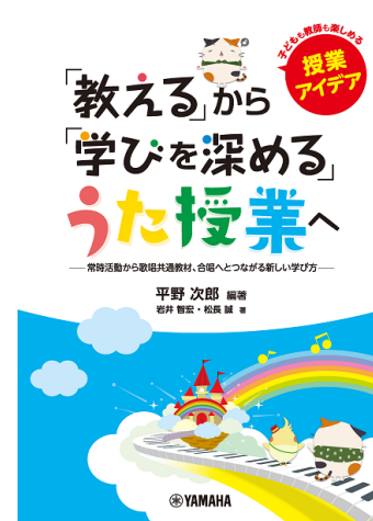
関連書籍 『「教える」から「学びを深める」うた授業へ』

デジタル音楽教材『うた授業』は、ICTならではの豊富な機能と映像、体系化されたコンテンツによって、子ども達も先生も無理なく自然に楽しめる歌唱の授業を可能にします。関連書籍には、先生の日頃の指導の悩みを解決する歌唱授業のアイデアを126ページに渡って収録し、今必要とされる音楽授業の実現をサポートします。