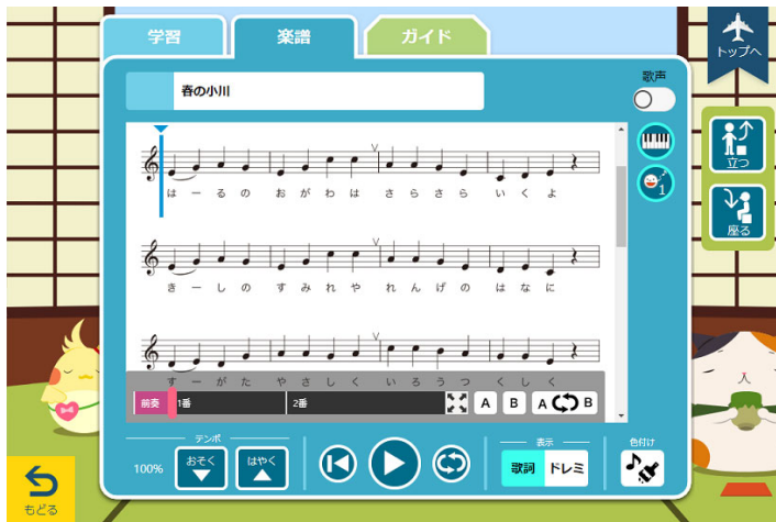
ヤマハデジタル音楽教材 『うた授業』

ヤマハ株式会社は、当社が展開する「Smart Education System」の新商品として、小学校向けのデジタル音楽教材『うた授業』を4月上旬より発売します。また、小学校での歌唱指導の授業アイデアをまとめた教員用の関連書籍『「教える」から「学びを深める」うた授業へ～常時活動から歌唱共通教材、合唱へとつながる新しい学び方～』も3月下旬より発売します。